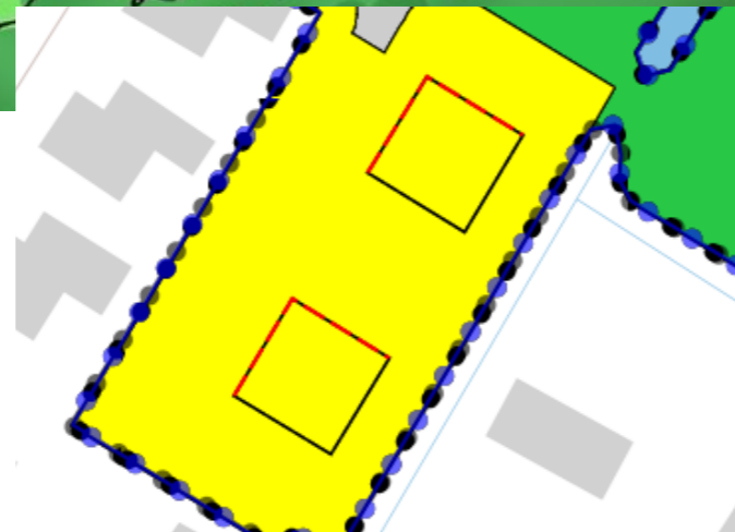
Verbeelding 1. Gevellijnen voor gevel zijn rood